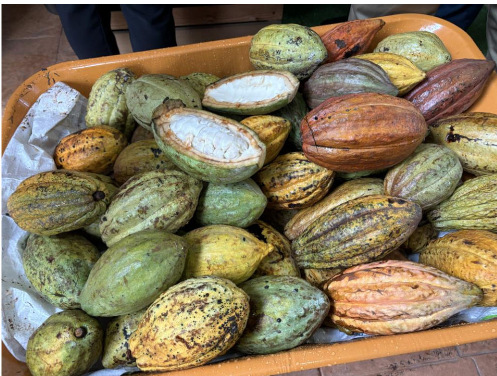
Gambar 3/ Picture 3

Picture 3: Cocoa bean prices have now reached a historic high, estimated at RM30,000 per metric ton.